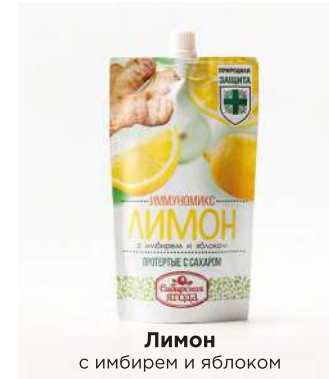
Лимон с имбирем и яблоком